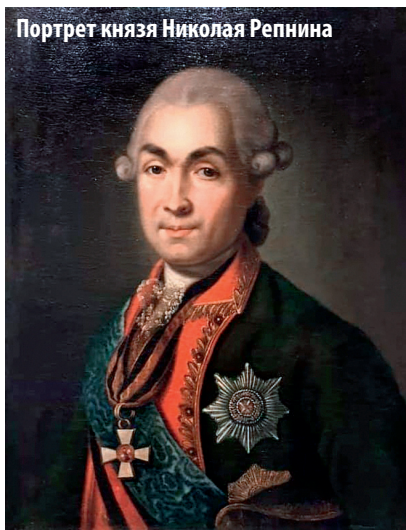
Портрет князя Николая Репнина

В позднесоветское время церковное здание превратилось в живо-