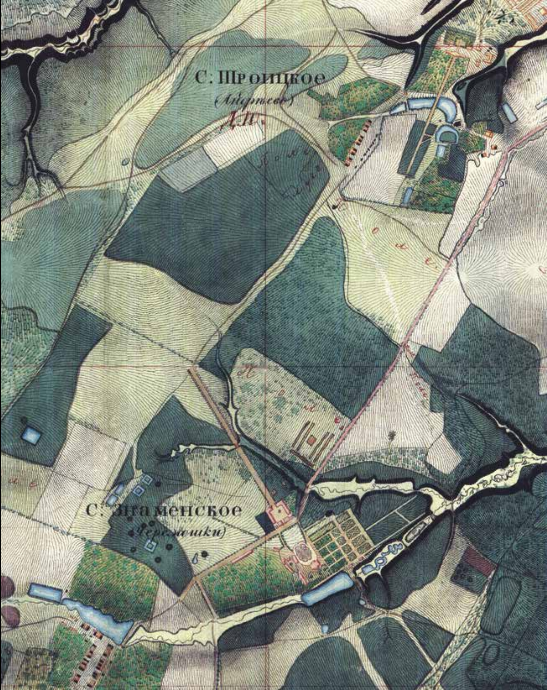
Фрагмент топографической карты Москвы и окрестностей 1838 г. Ясно видно, план усадьбы с расположением построек и прудовая система