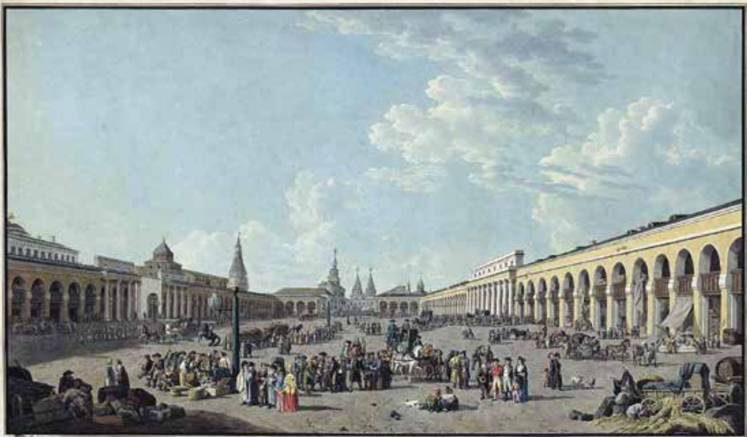
Жерар Делабарт. Лист из серии «Виды москвы», 1799 г.