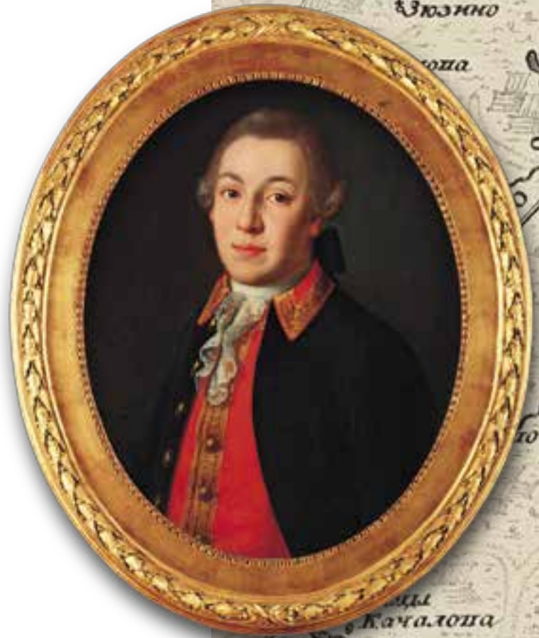
«Портрет неизвестного в красном камзоле» кисти А.П. Антропова, написанный им в 1766 году, дает нам характерный образ служилого дворянина того времени

История не сохранила нам портретов тех давних владельцев усадьбы. «Портрет неизвестного в красном камзоле» кисти А.П. Антропова, написанный им в 1766 году, дает нам характерный образ служилого дворянина того времени