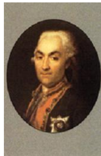
Д.Г. Левицкий. Портрет Н.В. Репнина. Конец XVIII в.

Здесь мне было поручено от Государя сделать большой шар, на котором 50 человек полетят, куда захотят, и по ветру и против ветра, а что от чего будет, узнаете и порадуетесь. Если погода будет хороша, то завтра или послезавтра ко мне будет маленький шар для пробы. Я вам заявляю, чтобы вы, увидя его, не подумали, что это от злодея (т.е. Наполеона. - М.К.), а он сделан к его вреду и гибели" 2 . Но ожидания