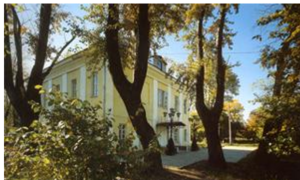
Южный корпус служб

Перед башнями, ближе к дороге, находятся более поздние пилоны ворот, установленные в конце XIX - начале XX в. Кроме этого, в Воронцове сохранились две пары флигелей, ориентировочно датируемые 1-й половиной XIX в. (те, которые ближе к дороге) и последней третью XVIII в. (они располагаются ближе к пруду). Все флигеля подверглись переделкам, утрачены отдельные элементы их декора, растесаны окна, но все же они интересны как памятники архитектуры. Один из флигелей XVIII в. ныне представляет собой руины, которые, тем не менее, выглядят достаточно эффектно в сравнении с парным ему зданием, испорченным переделками.