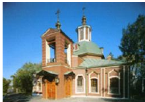
Церковь Троицы после реставрации