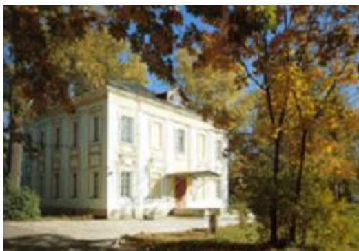
Северный корпус служб