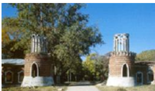
Въезд в усадьбу

Отрадно, что частично сохранилась планировка усадебного парка, впервые отмеченная еще на плане генерального межевания 1770 г. 15 От главных усадебных построек расходились три аллеи (сохранились две, одна из них ведет к парадному въезду). Такая трехлучевая система планировки в свое время была распространена, но почти нигде не уцелела. И хотя новые асфальтированные дорожки нарушают очарование парка, старые деревья в нем до сих пор не редкость. К сожалению, уже давно не