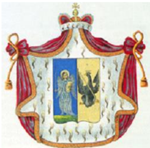
Герб рода князей Волконских

"Только что Леппих будет готов, составьте экипаж для его лодки из верных и умных людей и пошлите курьера к генералу Кутузову, чтобы предупредить его. Я сообщил ему об этом. Внушите, пожалуйста, Леппиху, чтобы он обратил хорошенько внимание на то место, где он спустится в первый раз, чтобы не ошибиться и не попасть в руки врага. Необходимо, чтоб он соображал свои движения с движениями главнокомандующего". (Оригинал письма на французском языке.)