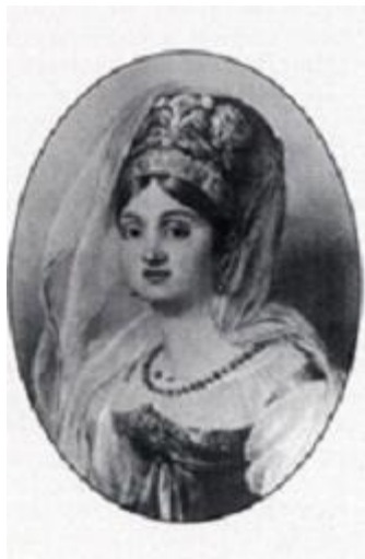
Ж.-Б. Изабэ. Портрет В.А. Репниной. 1815

москвичей оказались напрасными. Изобретателя постигла творческая неудача. Когда наполеоновские войска подошли к городу, большой шар с материалами и рабочие были на 130 подводах эвакуированы в Нижний Новгород, в котором тогда находился центр 3-го, или Низового, округа ополчения, возглавляемого графом П.А. Толстым, впоследствии владельцем соседнего имения Узкое.