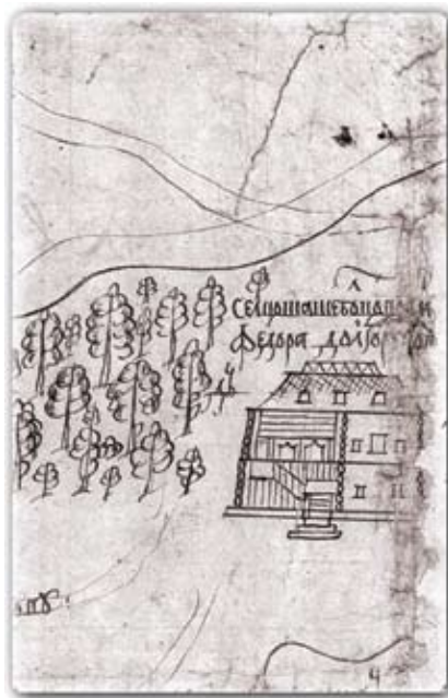
План селений Никольское, Шаболово и Черемوشья. 1694 год. РГАДА

домом, на второй этаж которого с улицы ведет парадное крыльцо. Стоящий на холме дом с высокой кровлей выглядит сказочным теремом, окруженным лесом. Судя по плану селений Никольское, Шаболово и Черемуха 1694 года, приложенному к спорному делу о размежевании Шаболова и Черемухи, дом в Шаболове — одна из самых значительных на тот момент усадебных построек в округе 8 .