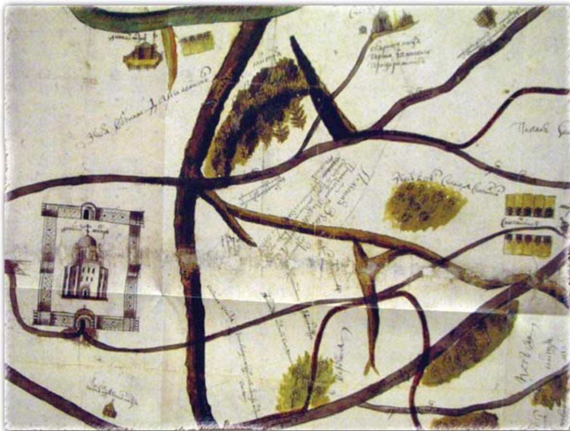
Чертеж земель от Земляного города до речки Раменки. Л. Антипин. 1692 год. РГАДА

На составленном в 1692 году подъячим Леонтием Антипиным «Чертеже земель от Земляного города до речки Раменки» в Шаболове показана выстроенная Ф. Б. Долгорукиим усадьба с большим деревянным двухэтажным