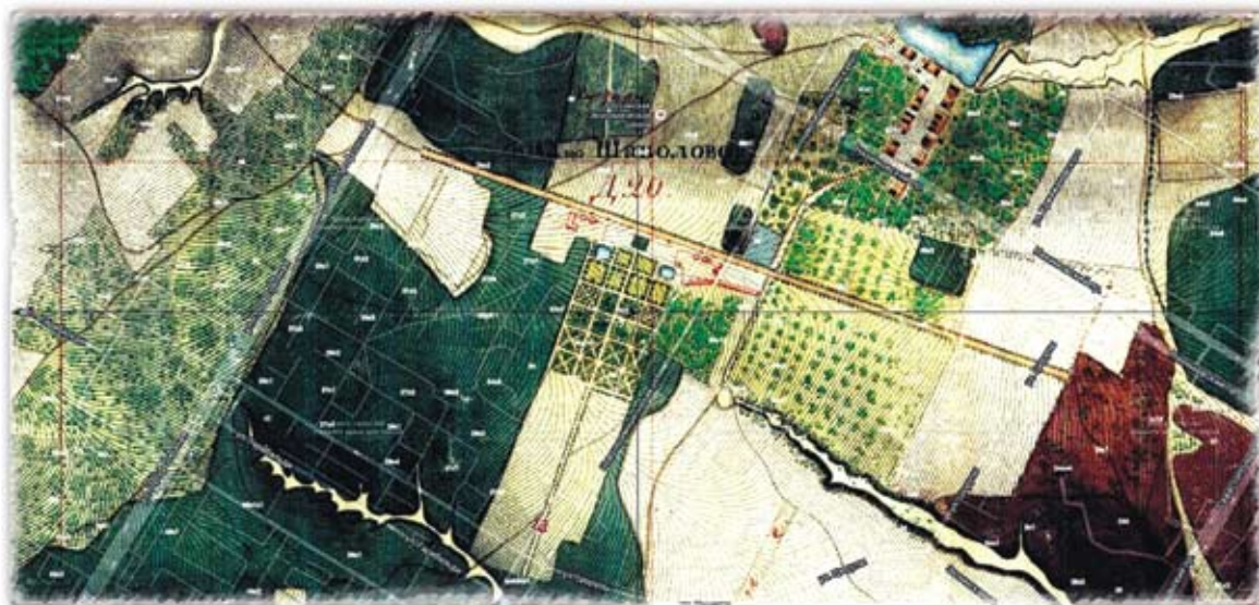
Усадьба Шаболово на плане Москвы 1838 года с указанием современных улиц

Об этой ныне утраченной подмосковной усадьбе