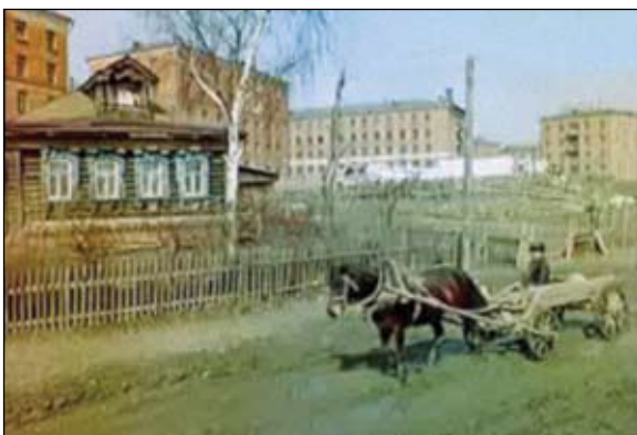
Деревня Шаболово перед сносом. 1950-е годы