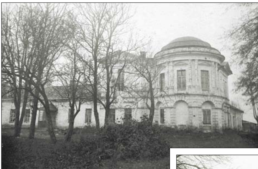
Флигель, ставший господским домом. Виды с востока, юго-востока и со стороны двора. Фотографии 1935 года.