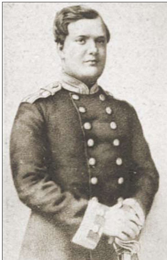
Николай Николаевич Бутурлин. Фотография 1870-х годов

На составленном при Н. А. Бутурлине в ходе проведения крестьянской реформы плане Шаболова (1861) видно, что к тому времени «западный» комплекс уже не существовал. Здесь появились три от-