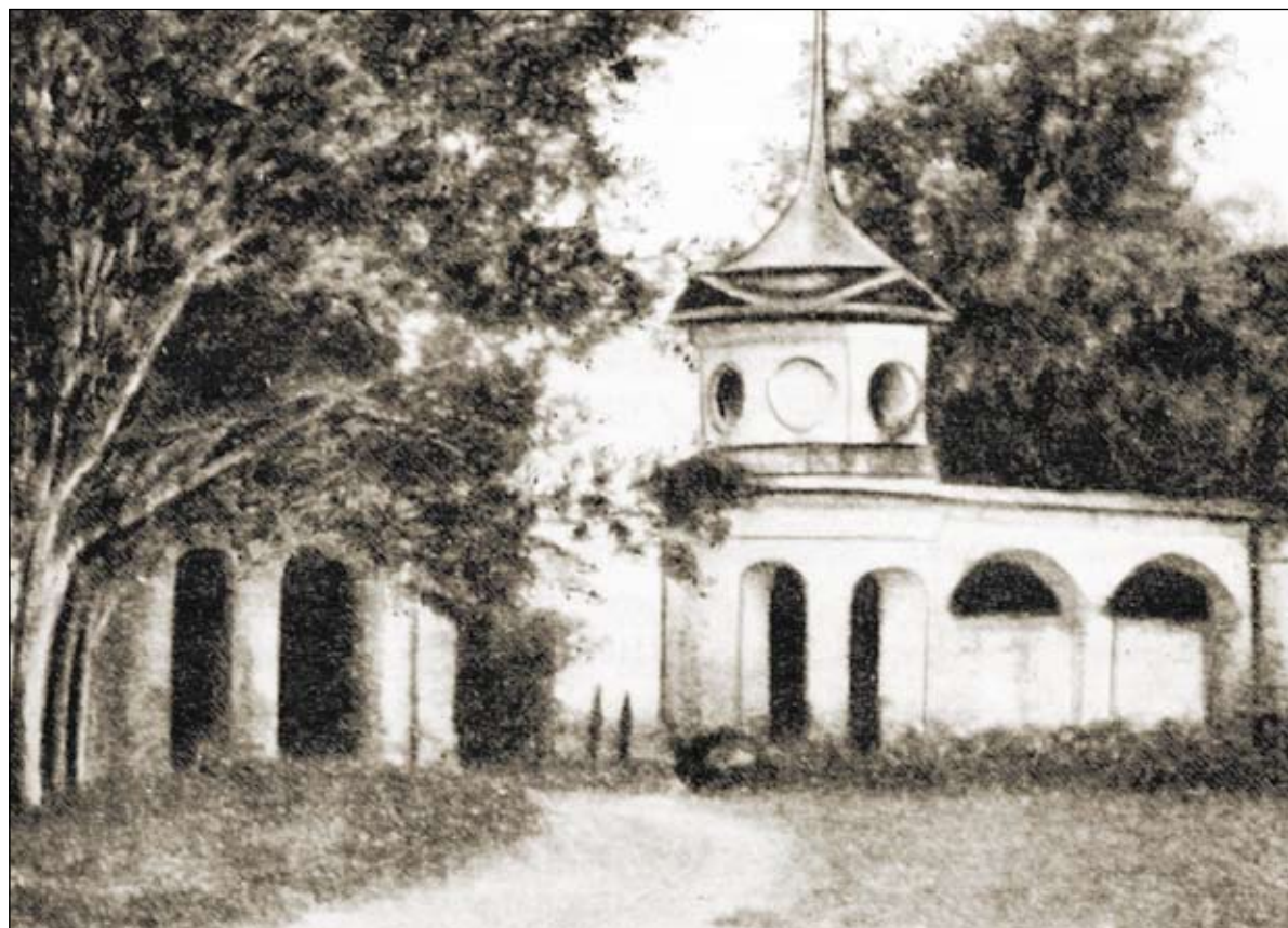
«Надпрудные» ворота. Фотография 1920-х годов. Из книги: Веселовский С. Б., Снегирев В. Л., Коробков Н. М. Подмосковье: Памятные места в истории русской культуры XIV–XIX вв. М., 1956

Флигель, показанный на плане 1952 года и, очевидно, являвшийся единственной исторической усадебной постройкой Шаболова, уцелевшей к тому моменту, был снесен при прокладке здешней части Новочеремушкинской (первоначально — 6-й Черемушкинской, в 1958–1963 годах — 4-й Черемушкинской) улицы в середине 1950-х годов. Место, на котором он стоял, оказалось на бульваре, разделяющем проезжие части улицы. Ныне оно с запада ограничено участком зданий школы-интерната № 19 (Новочеремушкинская улица, 44. 1964; ныне один из этих корпусов занимает школа-интернат № 56) и кинотеатром «Тбилиси» (Новочеремушкинская улица, 53 а. 1968). Тупиковый проезд между школьной территорией и соседним домом № 44, где в советское время располагался